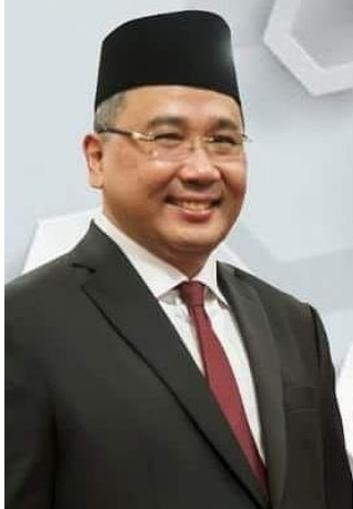
Eko Putro Sandjojo, BSEE., M.BA Menteri Desa PDDT

Tanggal 31 Agustus 2017 Pukul : 24.00 Wib